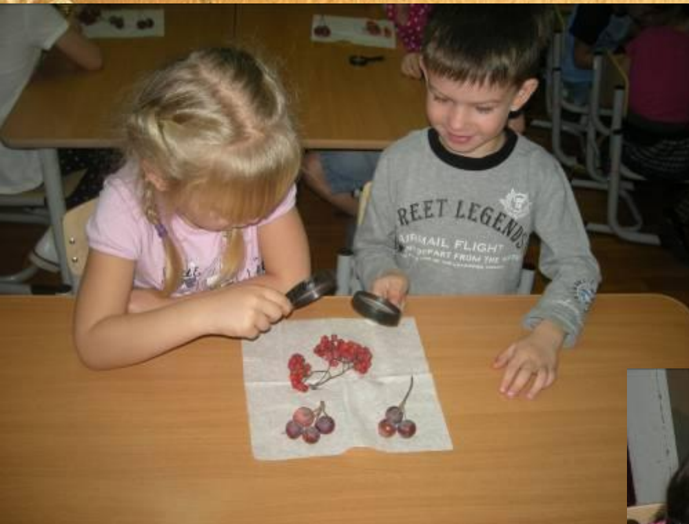
«Рассматривание плодов рябины»