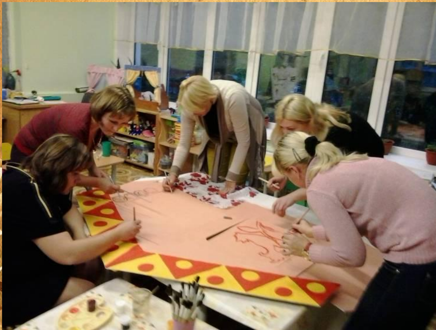
«Изготовление русской народной избы»