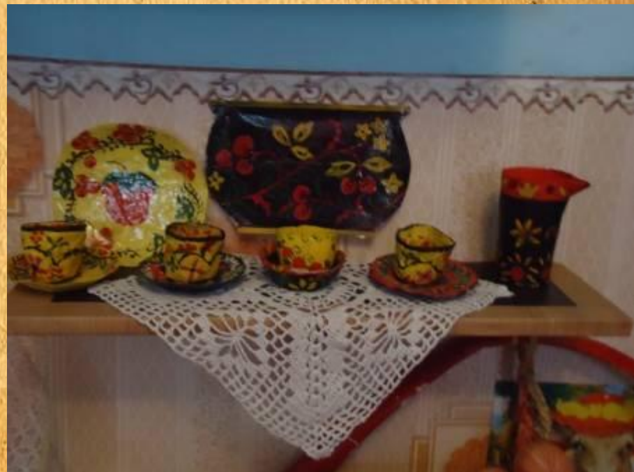
«Самодельная посуда» (папье маше)