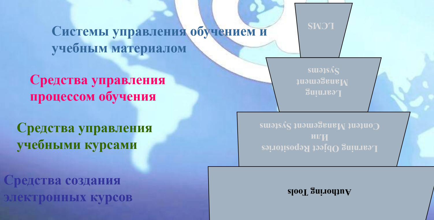
Рис. 1. Иерархия систем дистанционного обучения

Системы дистанционного обучения бывают различной степени сложности. Визуально иерархию систем дистанционного обучения можно представить в виде пирамиды, изображенной на рисунке 1.