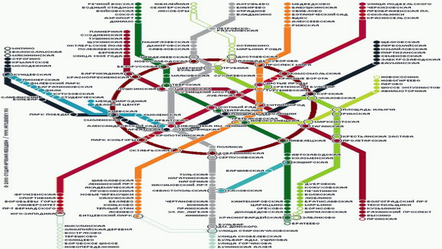
СХЕМА ЛИНИЙ МОСКОВСКОГО МЕТРОПОЛИТЕНА