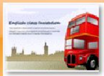
Приглашение в группу английского языка