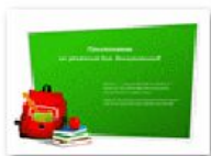
Приглашение на занятия для дошкольников