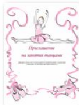
Приглашение на занятия танцами