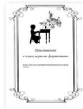
Приглашение в класс игры на фортепиано