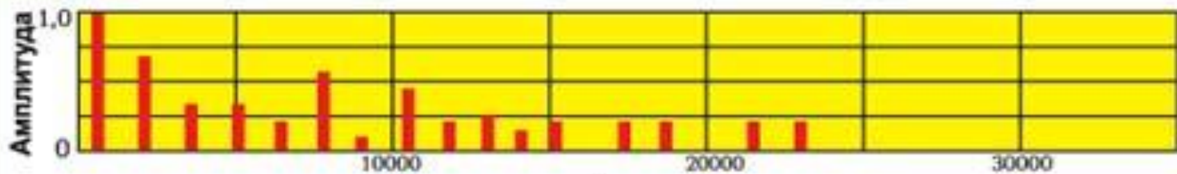
Частотный спектр звука