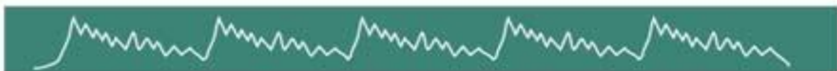
ОСЦИЛЛОГРАММА ЗВУКОВОЙ ВОЛНЫ