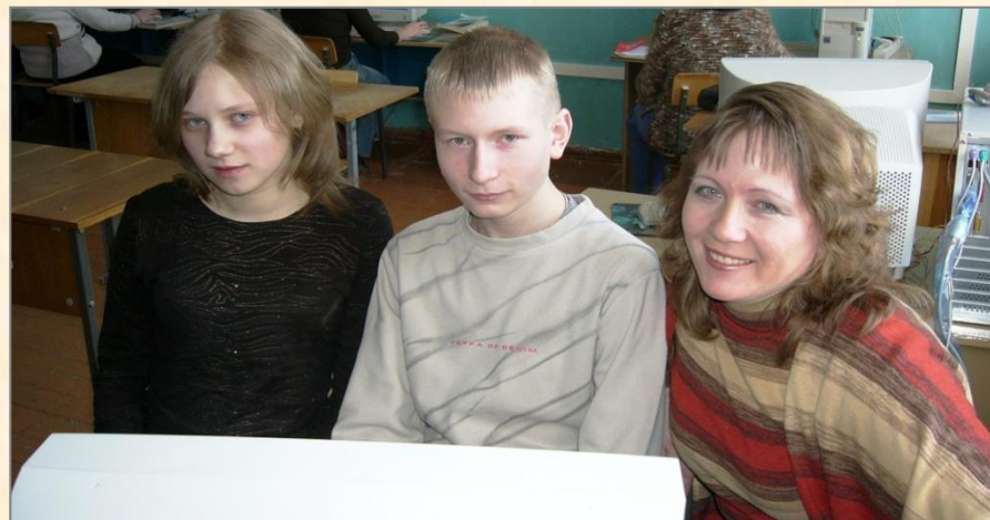
«Высший пилотаж языка»