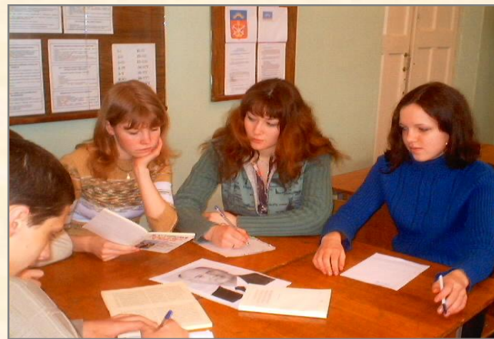
«Ломать не строить»