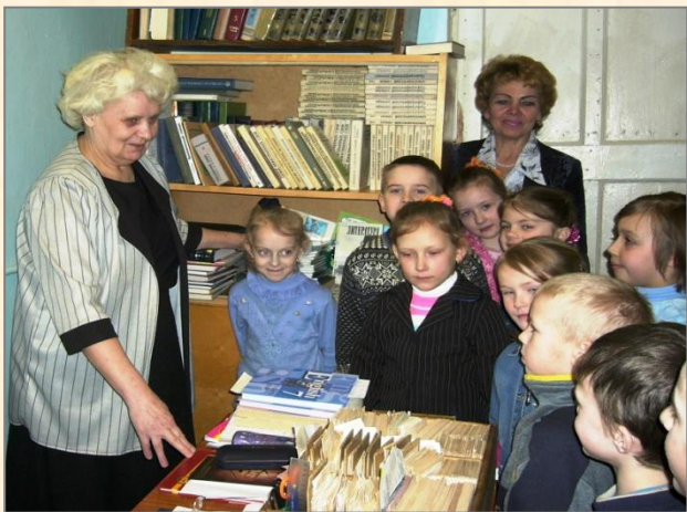
«Где прячется алфавит?»