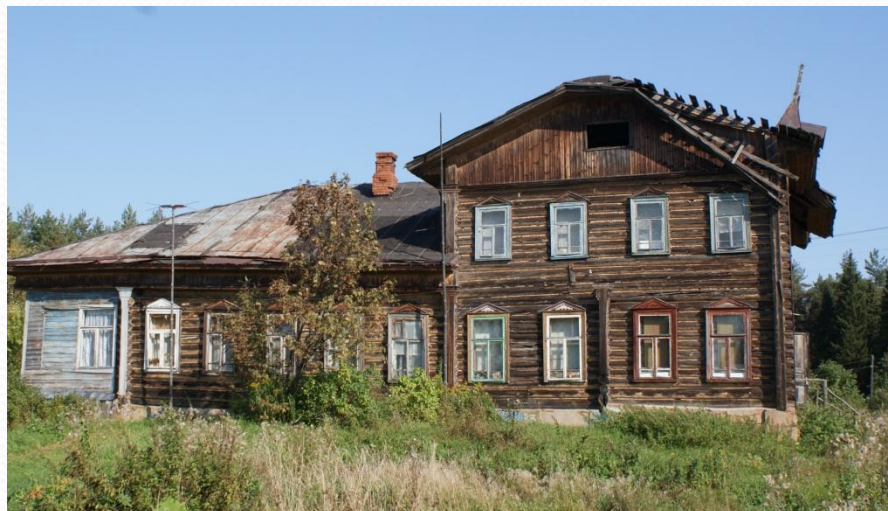
Дом бывшей дачи Е.М. Кузнецовой. Д.Приволье.2006г.