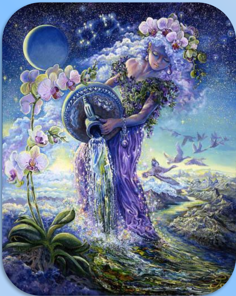
Мой знак зодиака Водолей