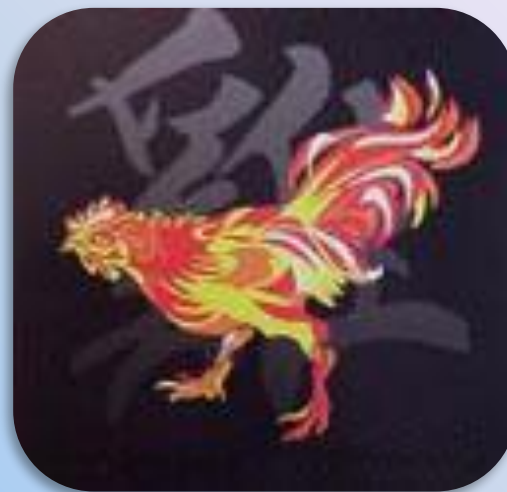
По восточному гороскопу я Петух