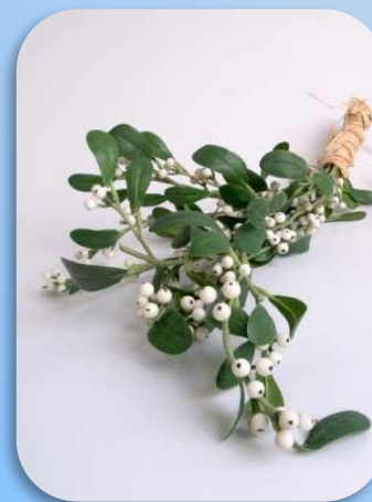
Цветочный гороскоп Омела