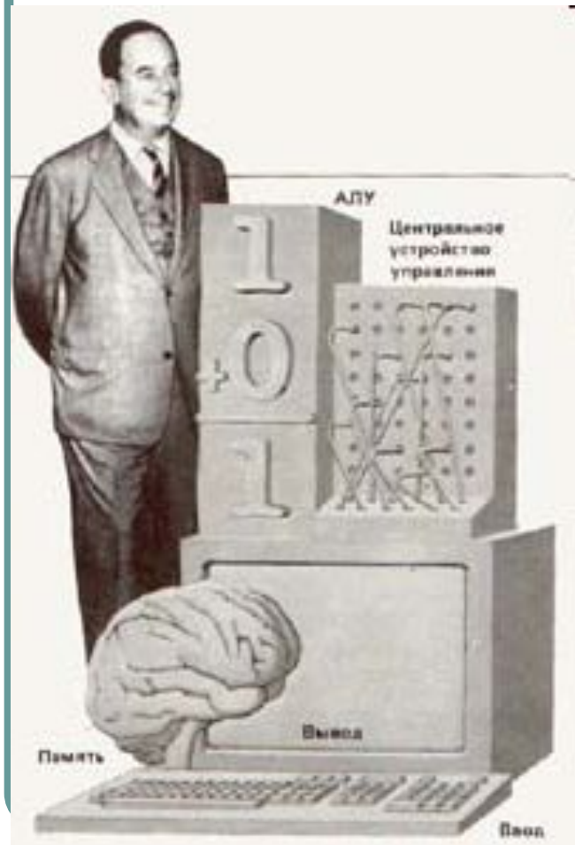
Схема устройства компьютера впервые была предложена в 1946 году американским ученым Джоном фон Нейманом. Дж. фон Нейман сформулировал основные принципы работы ЭВМ, которые во многом сохранились и в современных компьютерах.