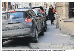
Наведение порядка с парковкой, безусловно, необходимо