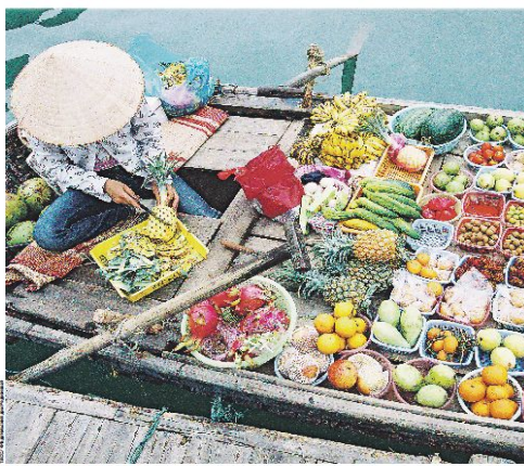
Выяснение торговых условий доставить в Россию больше товаров

Вьетнам в конце мая войдет в зону свободной торговли ЕАЭС. Это означает, что вьетнамские товары смогут беспрепятственно поступать на рынки стран Евразийского экономического союза. Вьетнамские производители уже начали готовиться к этому событию. Они начинают налаживать связи с российскими партнерами, изучают требования к качеству продукции. Вьетнамские производители уже начали налаживать связи с российскими партнерами, изучают требования к качеству продукции. Вьетнамские производители уже начали налаживать связи с российскими партнерами, изучают требования к качеству продукции.