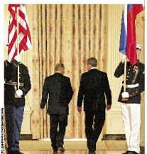
Разоблачат ли агты России в Америке?