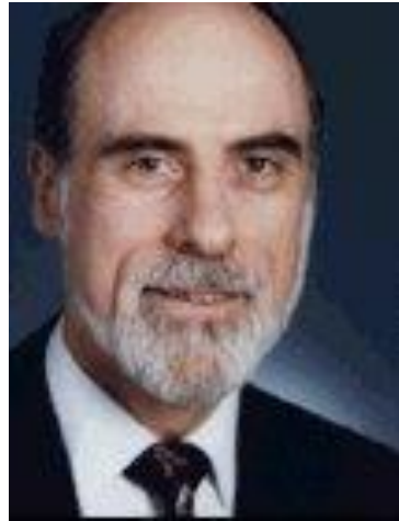
Винсент Сёрф, «Отец Интернета»