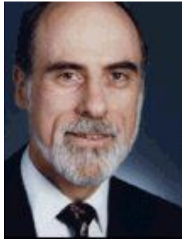
Винсент Сёрф, «Отец Интернета»