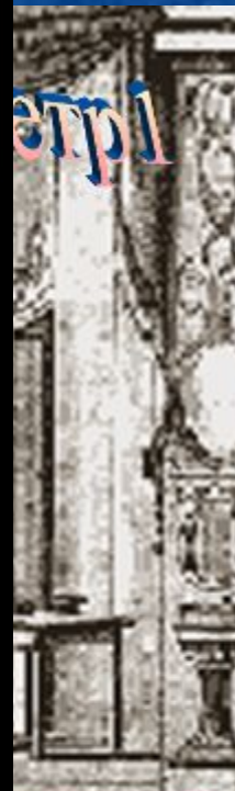
портреты Петра первого)