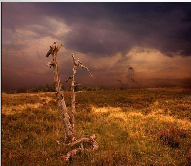
Природа с человеком