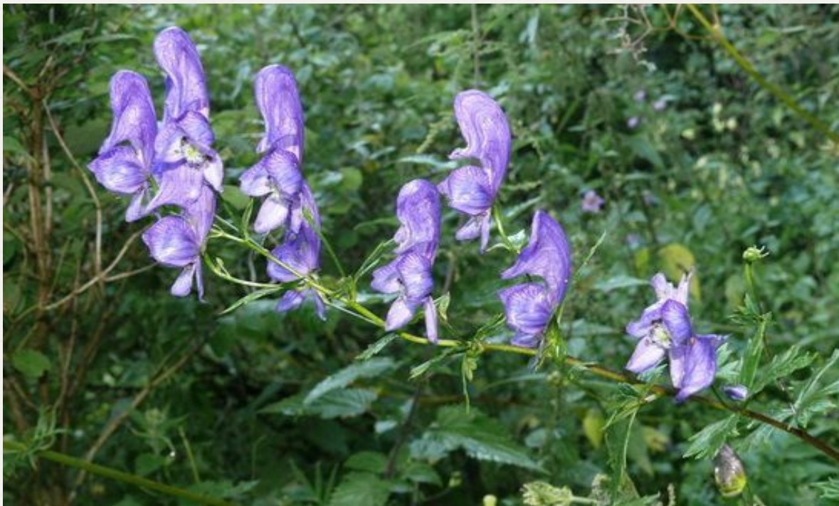
0 Аконит Джунгарский