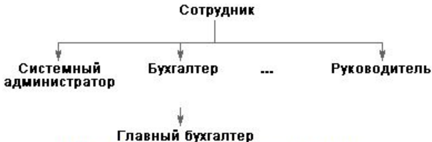
Рис. 10.3. Фрагмент иерархии ролей.