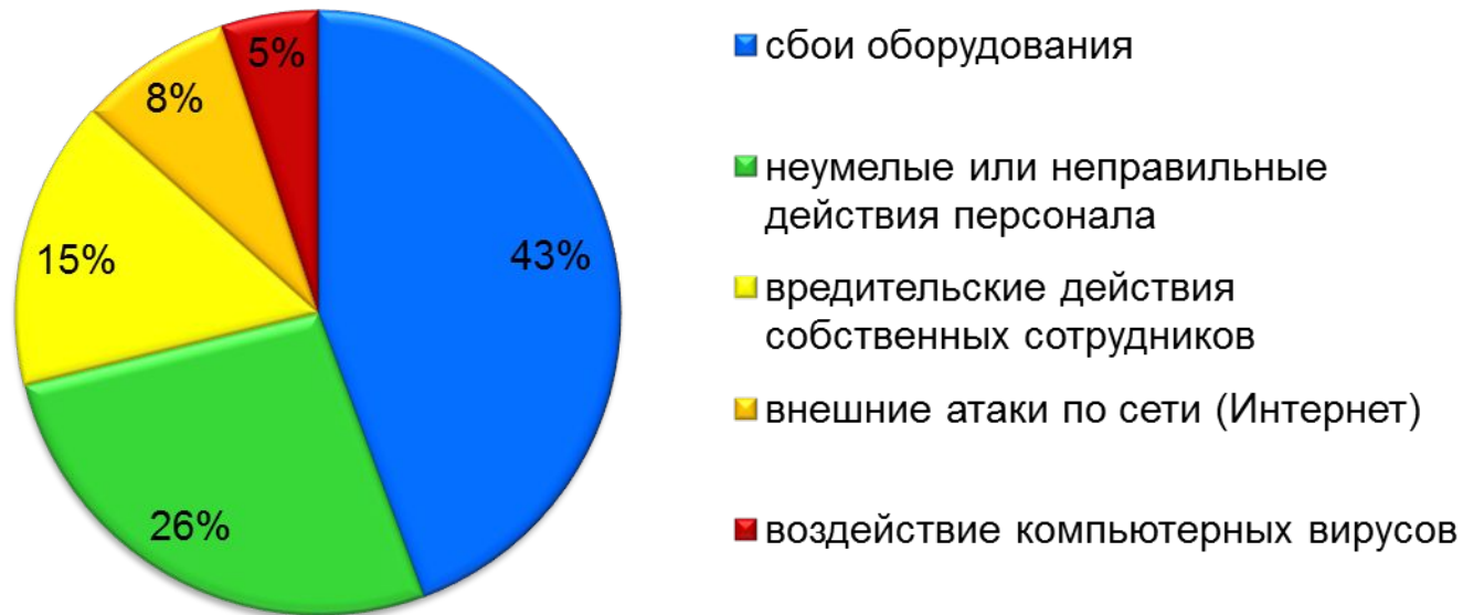
Основные информационные угрозы

Анализ угроз проведенных агентством национальной ассоциацией информационной безопасности (National Computer Security Association) в 1998 г. в США выявил следующую статистику: