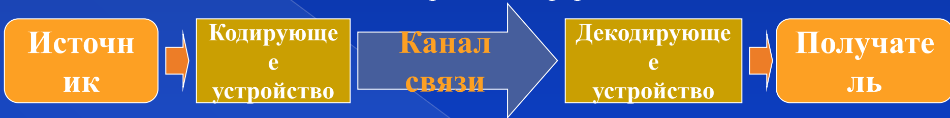
Схема передачи информации