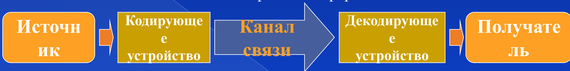
Схема передачи информации