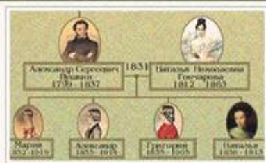
Родословная А.С. Пушкина в портретах