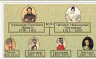
Родословная А.С. Пушкина в портретах