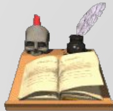
Текст научной книги