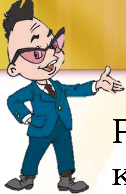
Рисунок – это графические данные , которые несут нам графическую информацию .