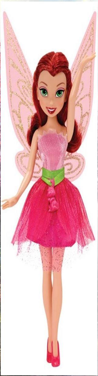
Игра с Летней Принцессой