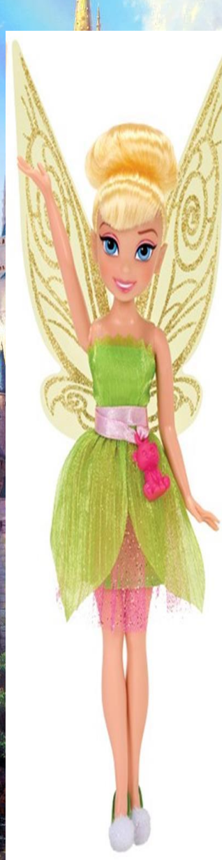
Игра с Весенней Принцессой