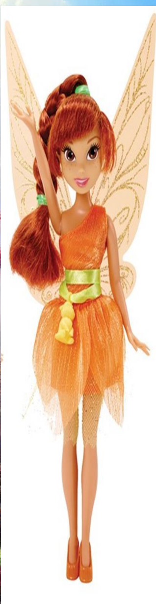
Игра с Осенней Принцессой