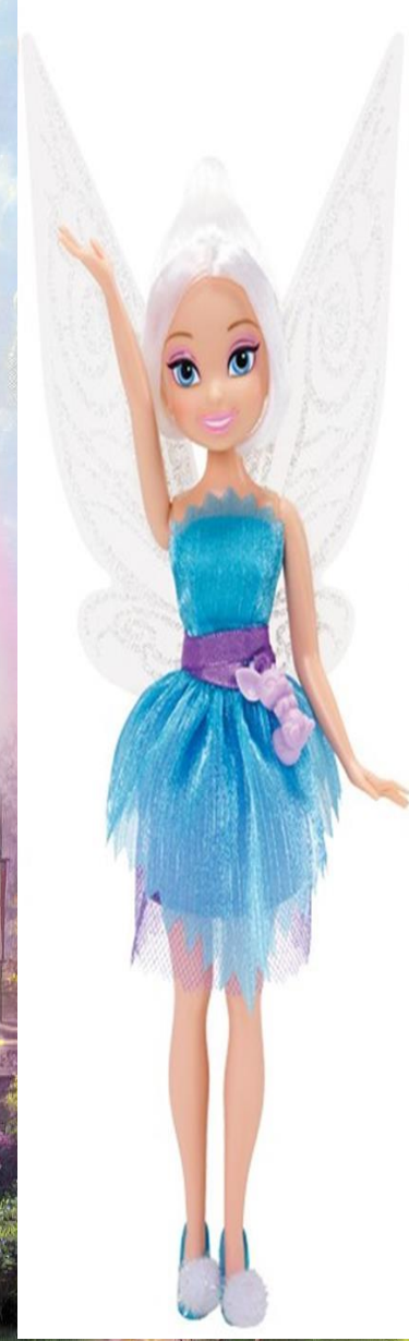
Игра с Зимней Принцессой