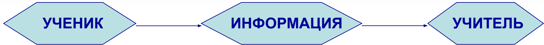
Схема образовательной парадигмы

Исходя из этой цели, необходимо решить следующие задачи: