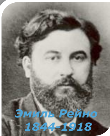
Эмиль Рейно 1844-1918