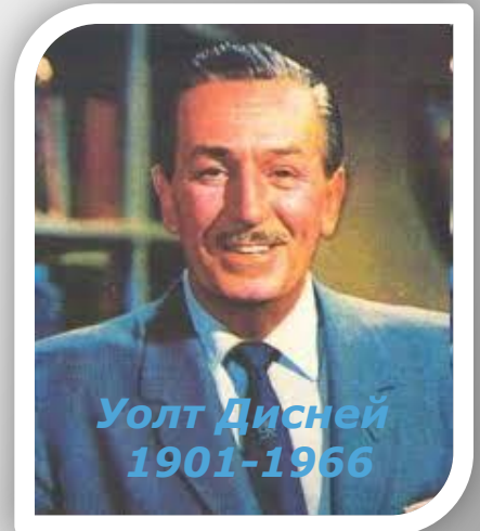
Уолт Дисней 1901-1966

т/ф «Комические фазы смешных лиц» («Humorous phases of funny faces», 1906 г.)