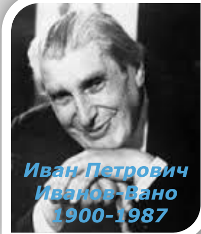
Иван Петрович Иванов-Вано 1900-1987