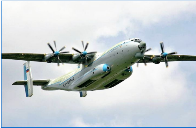
Ан-22: для перевозки грузов