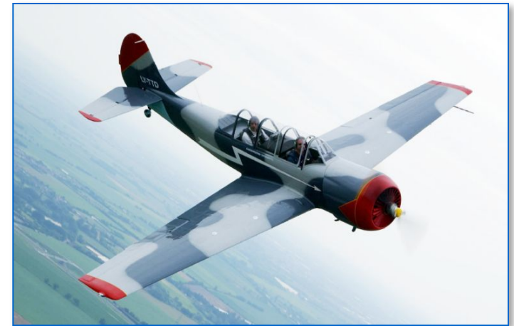
ЯК-52: тренировочный самолёт