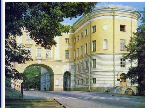
Экскурсовод в Царскосельском лицее