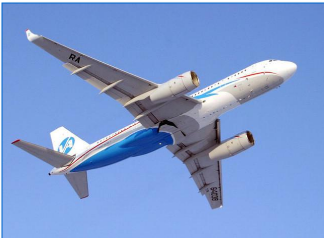
Ту-204: пассажирский самолёт