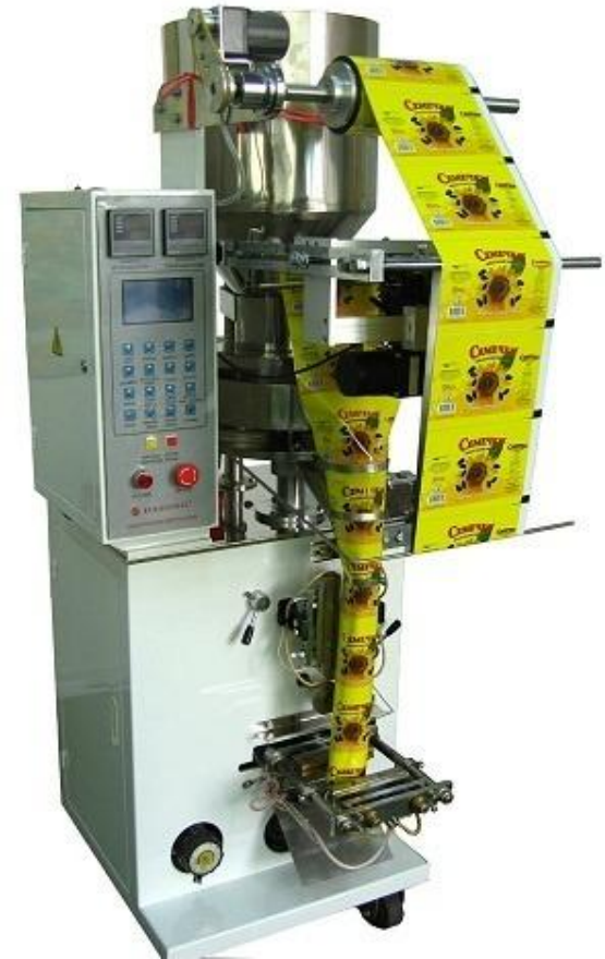
Автоматический фасовочно-упаковочный аппарат