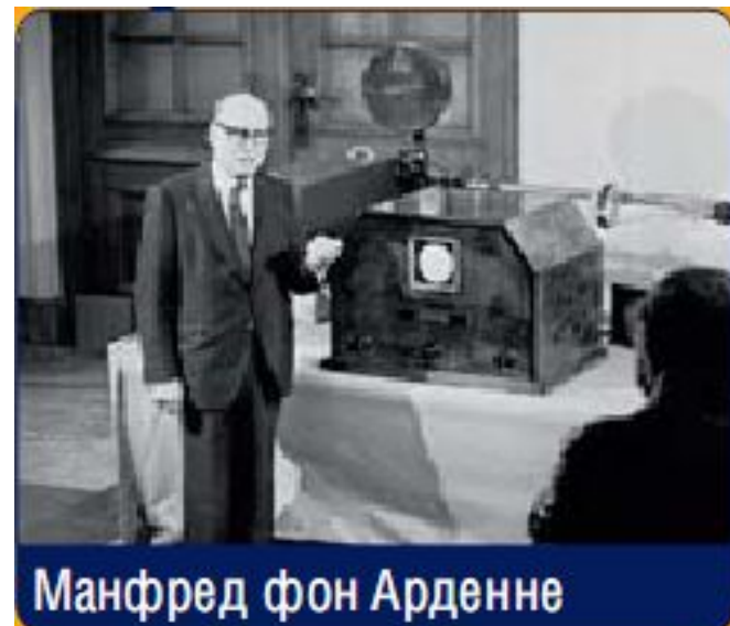
Манфред фон Арденне

Манфреду фон Арденне удалось создать устройства для осуществления полностью электронной передачи телевизионного сигнала. В 1931 году он представляет свое изобретение на Международной выставке радиотехники в Берлине.