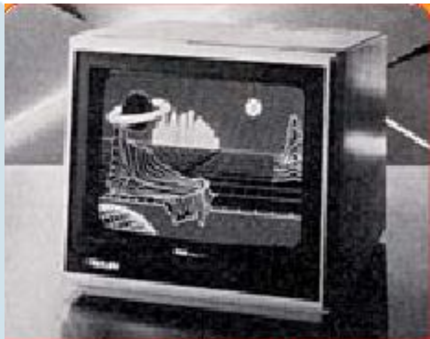
Монитор Taxan Vision