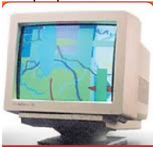
NEC MultiSync 4D