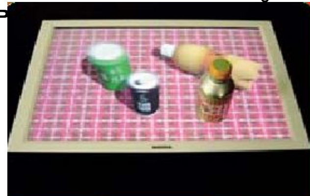
Образец 3D-монитора Toshiba

Уже через несколько лет появятся операционные системы с 3D-интерфейсом и настоящие 3D-игры, виртуальные миры которых будут полностью трехмерными. В настоящее время уже доступны несколько десятков моделей жидкокристаллических 3D-мониторов, позволяющих получать трехмерные изображения при помощи очков. Тот факт, что почти все производители мониторов работают над 3D-техникой, позволяет ждать ближайшем будущем.