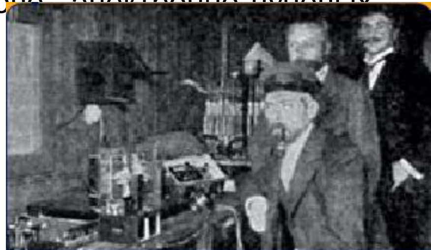
Карл Фердинанд Браун в лаборатории

Изобретателем электронно-лучевых трубок часто называют Карла Фердинанда Брауна. Но истина в том, что он первым в 1897 году начал применять трубки на практике — в осциллоскопе. Принцип работы этого прибора лег в основу всех последующих изобретений, таких как телевизор или экран радиолокатора. В том же году Джозеф Джон Томсон открыл электрон, что значительно ускорило развитие техники на основе электронно-лучевых трубок.