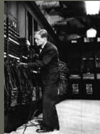
Компьютер "Эниак" Первое поколение

В основе работы ЭВМ первого поколения лежали электронные лампы. Примером ЭВМ первого поколения служит компьютер «Эниак».