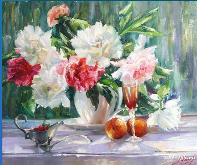
Аналоговое (картина маслом)