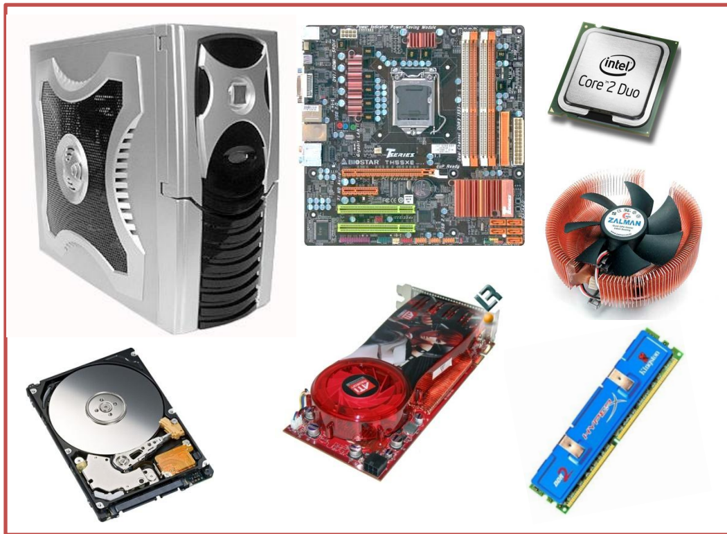
Компьютер по комплектующим