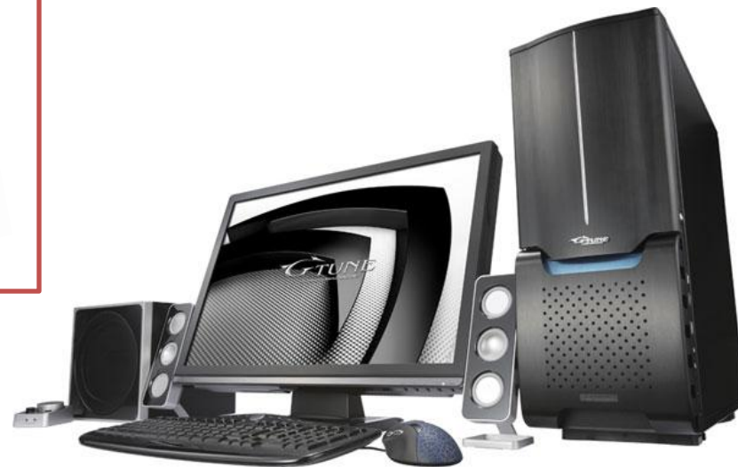
Компьютер в сборе