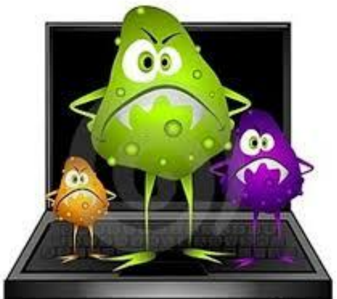
Иллюстрация: Илья Смирнов