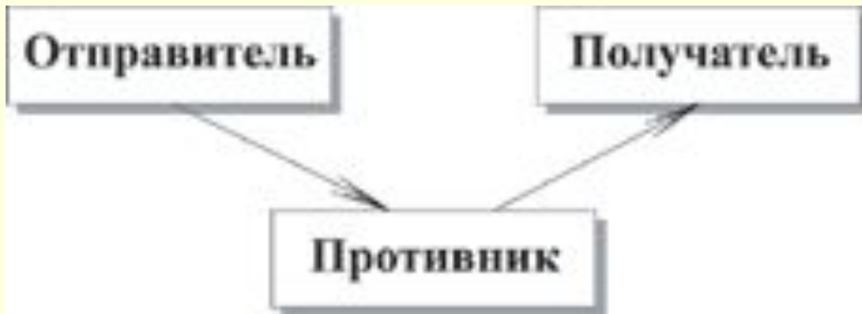
Рис. 1.5. Атака "man in the middle"

Модификация потока данных означает либо изменение содержимого пересылаемого сообщения, либо изменение порядка сообщений.