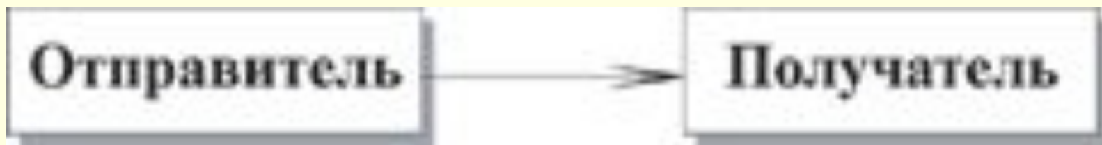
Рис. 1.2. Информационный поток

В общем случае существует информационный поток от отправителя (файл, пользователь, компьютер) к получателю (файл, пользователь, компьютер):