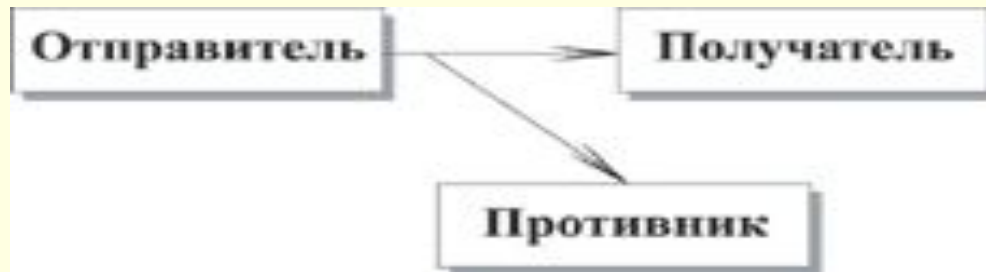
Рис. 1.3. Пассивная атака

Пассивной называется такая атака , при которой противник не имеет возможности модифицировать передаваемые сообщения и вставлять в информационный канал между отправителем и получателем свои сообщения. Целью пассивной атаки может быть только прослушивание передаваемых сообщений и анализ трафика.