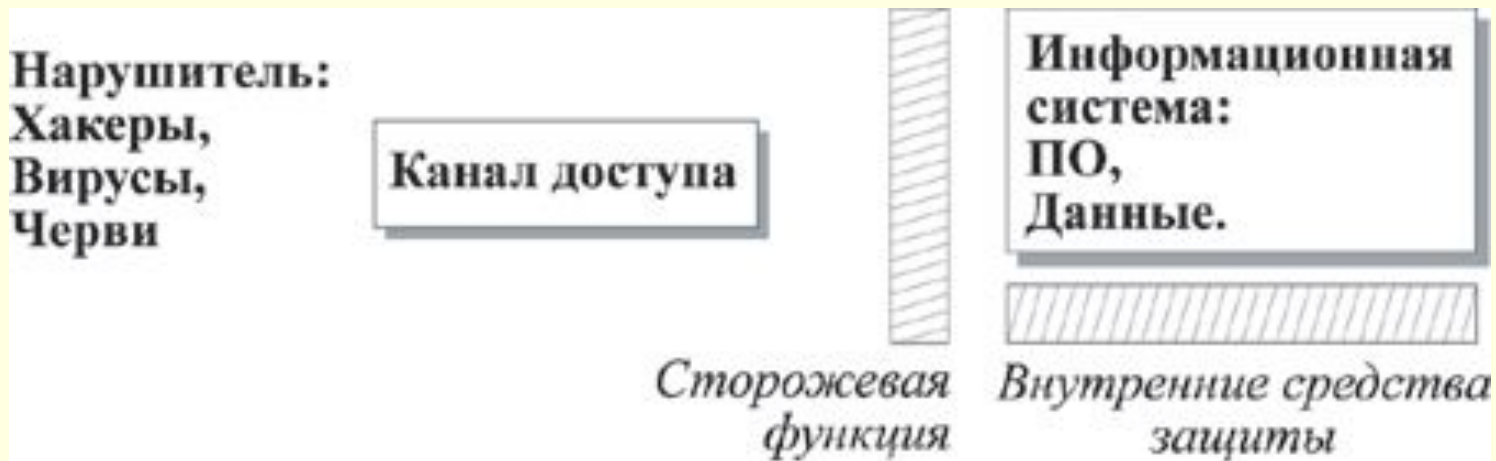
Рис. 1.9. Модель безопасности информационной системы

Существуют и другие относящиеся к безопасности ситуации, которые не соответствуют описанной выше модели сетевой безопасности. Общую модель этих ситуаций можно проиллюстрировать следующим образом: