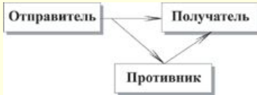
Рис. 1.7. Replay-атака

Повторное использование означает пассивный захват данных с последующей их пересылкой для получения несанкционированного доступа - это так называемая replay-атака . На самом деле replay-атаки являются одним из вариантов фальсификации, но в силу того, что это один из наиболее распространенных вариантов атаки для получения несанкционированного доступа, его часто рассматривают как отдельный тип атаки .