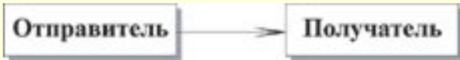
Рис. 1.2. Информационный поток

В общем случае существует информационный поток от отправителя (файл, пользователь, компьютер) к получателю (файл, пользователь, компьютер):