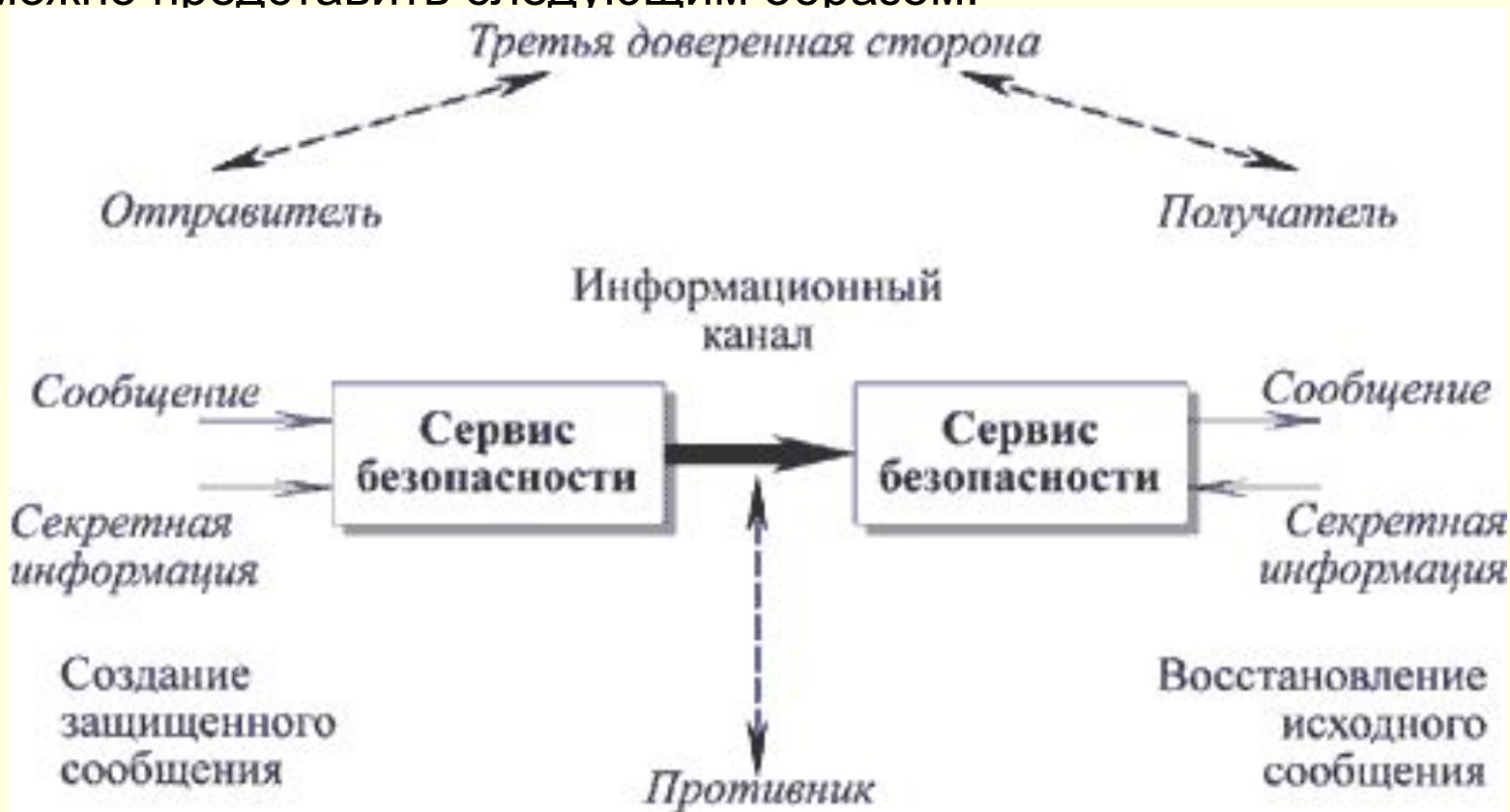
Рис. 1.8. Модель сетевой безопасности

Модель безопасного сетевого взаимодействия в общем виде можно представить следующим образом: