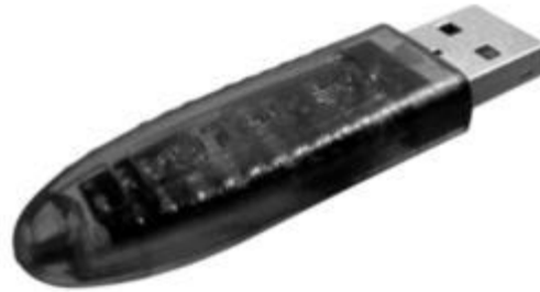
Общий вид персональных идентификаторов типа ruToken

Электронный идентификатор ruToken позволяет обеспечить: