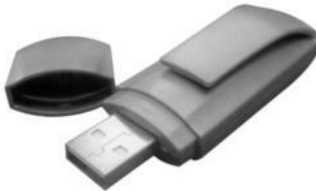
Внешний вид персонального шифратора Шипка-1.5

Шипка-1.5 – аббревиатура от слов “ Шифрование – Идентификация – Подпись – Коды Аутентификации ”– это USB- устройство, в котором аппаратно реализованы: