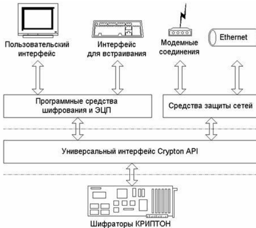
Программный интерфейс Crypton API .