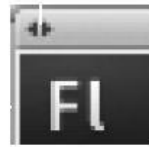
Рис. 2.2. Для переключения между видами с одной и двумя колонками щелкните по двойному треугольнику в левом верхнем углу панели.