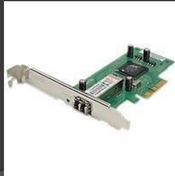
Сетевой адаптер типа Ethernet