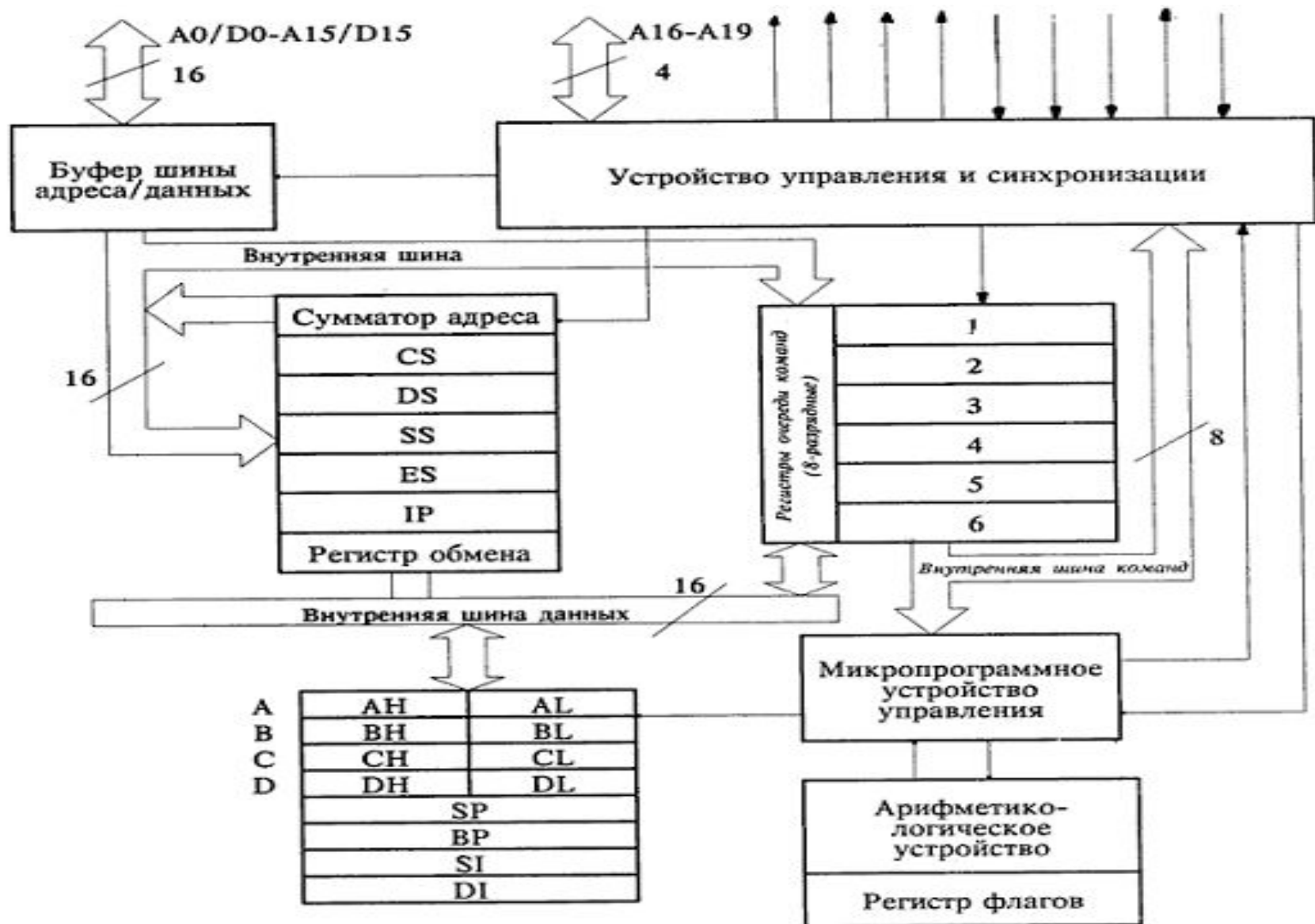
Рис.2. Внутренняя структура микропроцессора 8086.