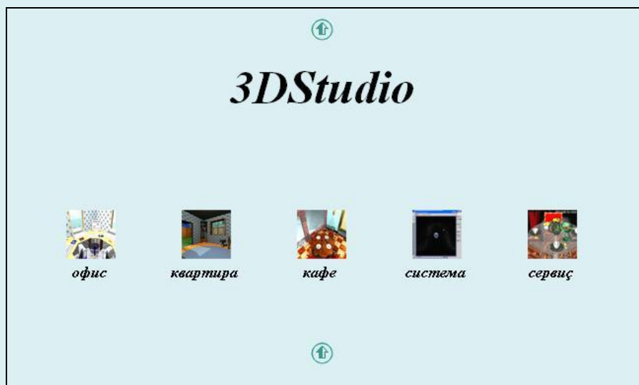
Рис.8 Страница 3DStudio