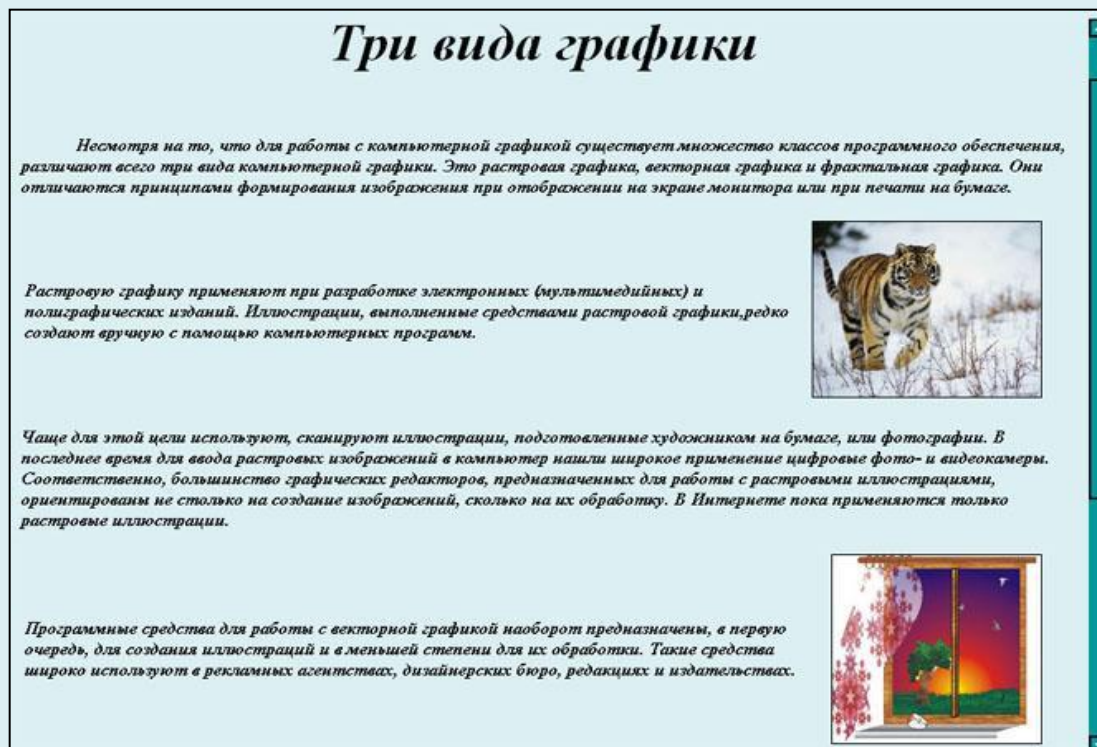
Рис.3 Внешний вид страницы «Три вида графики»

Он включает: Введение Виды компьютерной графики Три вида графики Растровая графика Векторная графика Соотношение между векторной и растровой графики Понятие о фрактальной графике Основные понятия о компьютерной графике Основные понятия компьютерной графики Цветовое разрешение и цветовые модели Цветовая палитра