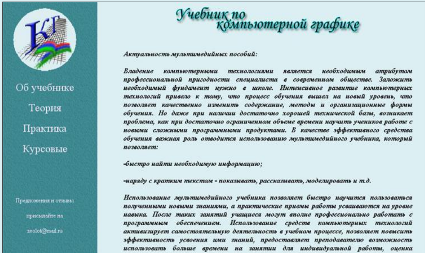
Рис.1 Внешний вид учебника

Учебный материал размещен в трех частях: теории, практики, курсовые проекты.