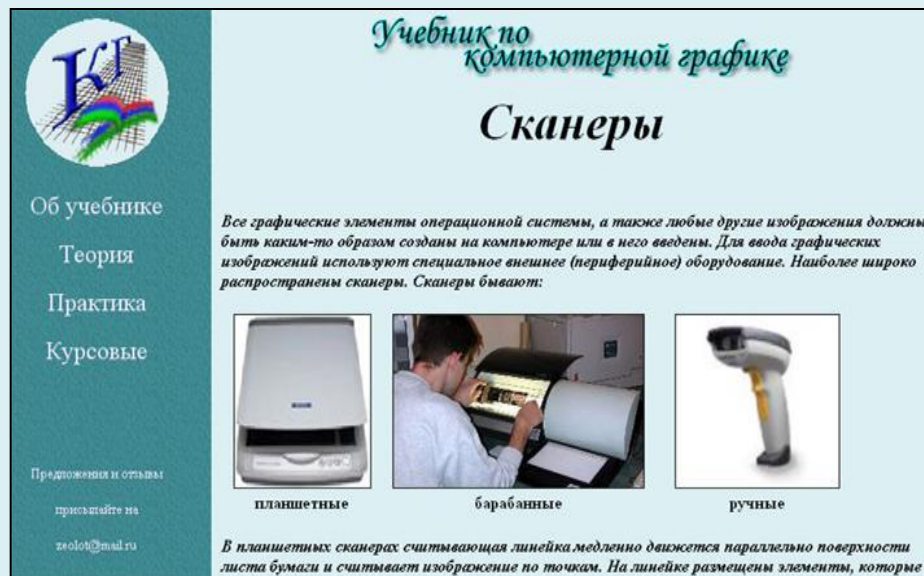
Рис.3 Внешний вид страницы «Сканеры»