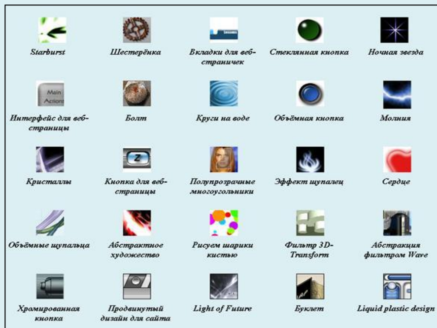
Рис.5 Раздел «Другие эффекты»

Раздел Другие эффекты включает тридцать один эффект: