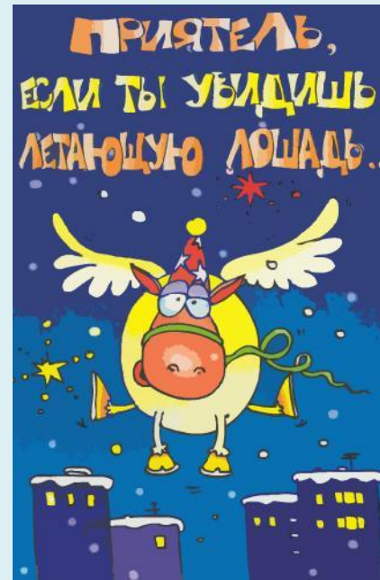
Рис.9 Открытка 3

Новогодние открытки Открытка 1 Открытка 2 Открытка 3 Дискотека Времена года Подснежник Подснежник 1 Подснежник 2