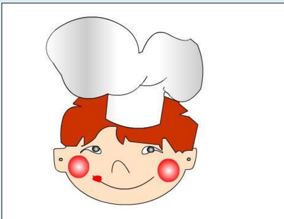
Рис.7 Упражнение «Повар»

Часть «Упражнения» подразделена на восемнадцать упражнений, которые нужно выполнить для закрепления навыков работы с программой Macromedia Flash . Это: «Повар», «Самолет», «Солнце», «Мяч», «Зарядка», «Лист», «Колесо», «Лестница», «Линии», «Дельфин», «Балерина», «Планета», «Футбол», «Shape» «Фантазия».