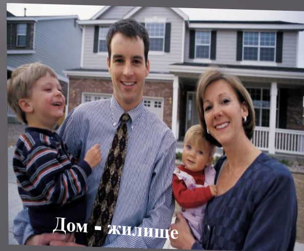
Дом - жилище