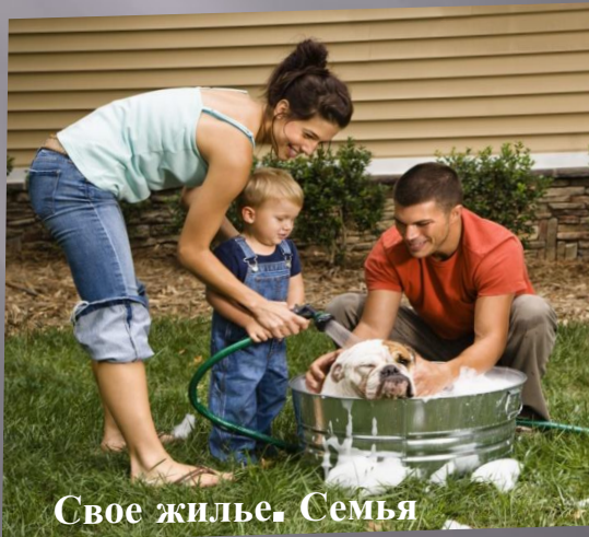
Свое жильё. Семья