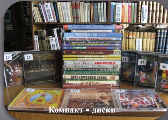
Компакт - диски