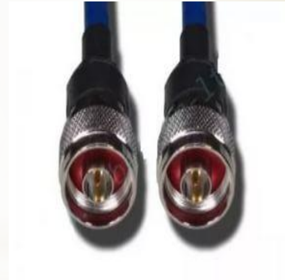
Кабель N типа