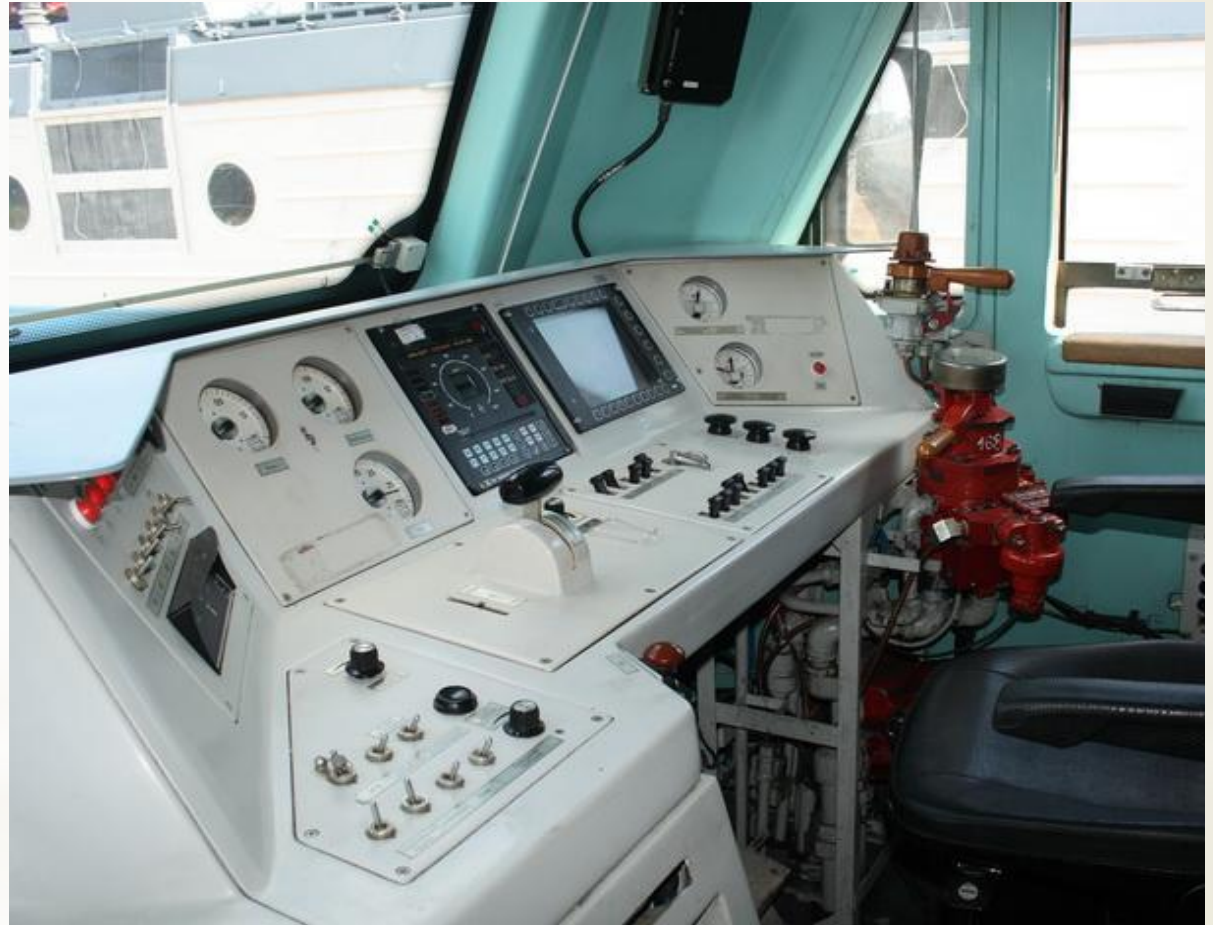
Кабина электровоза ЗЭС5К Ермак