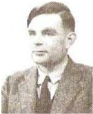
Алан Тьюринг (1912-1954), Англия

В 80-х годах XX века возникает новая наука — теория алгоритмов.