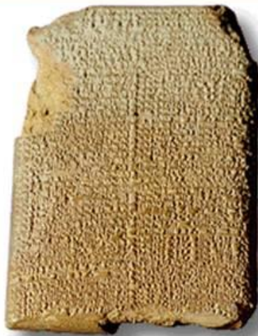
Глиняная табличка из Древнего Вавилона (VI век до нашей эры)

Ашшурбанапал - один из последних ассирийских царей