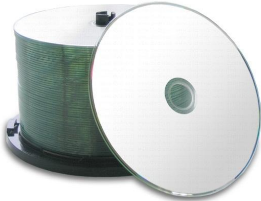
CD 700 Мб