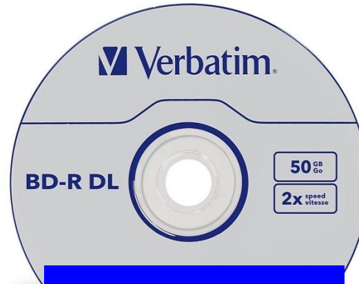
Blue Ray 25 Гб x 2