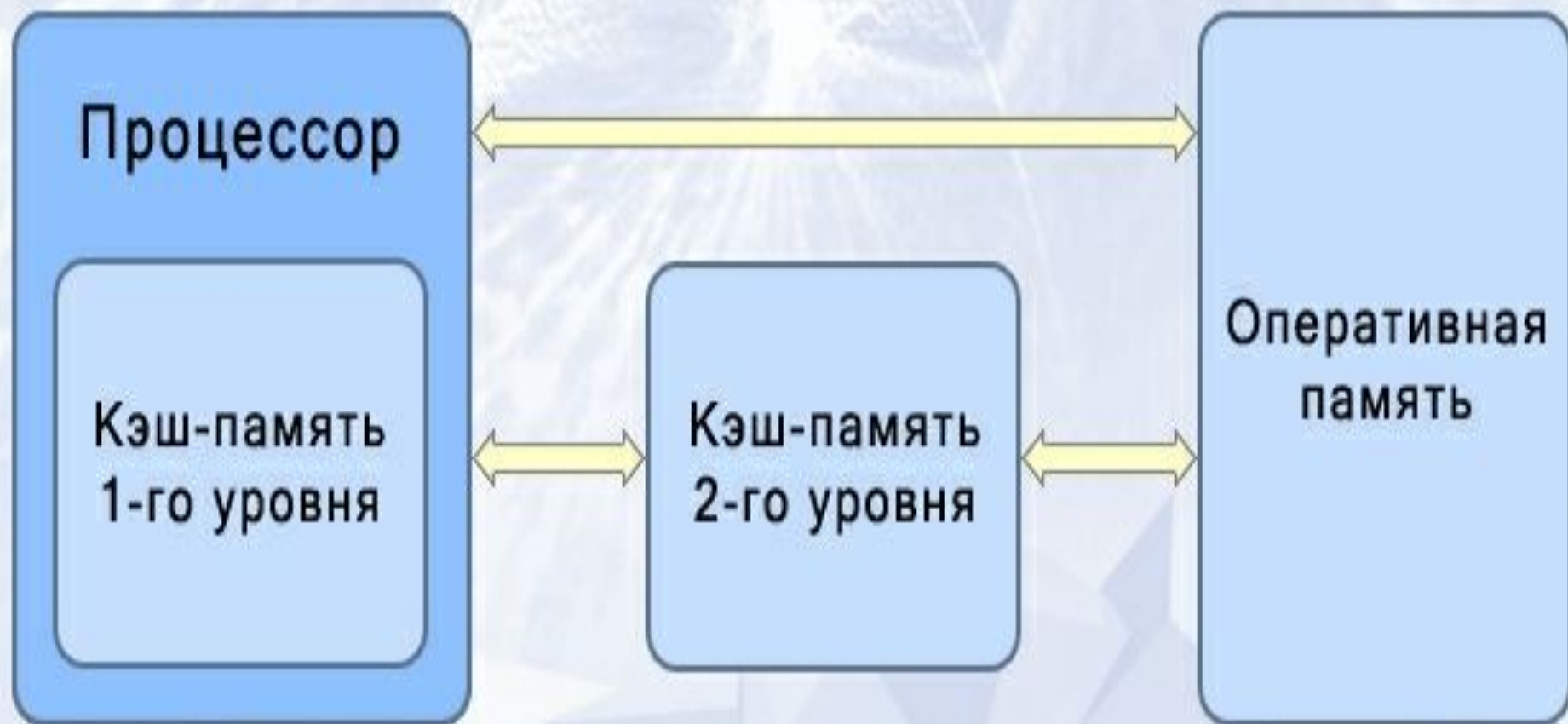
Схема устройства кэш-памяти