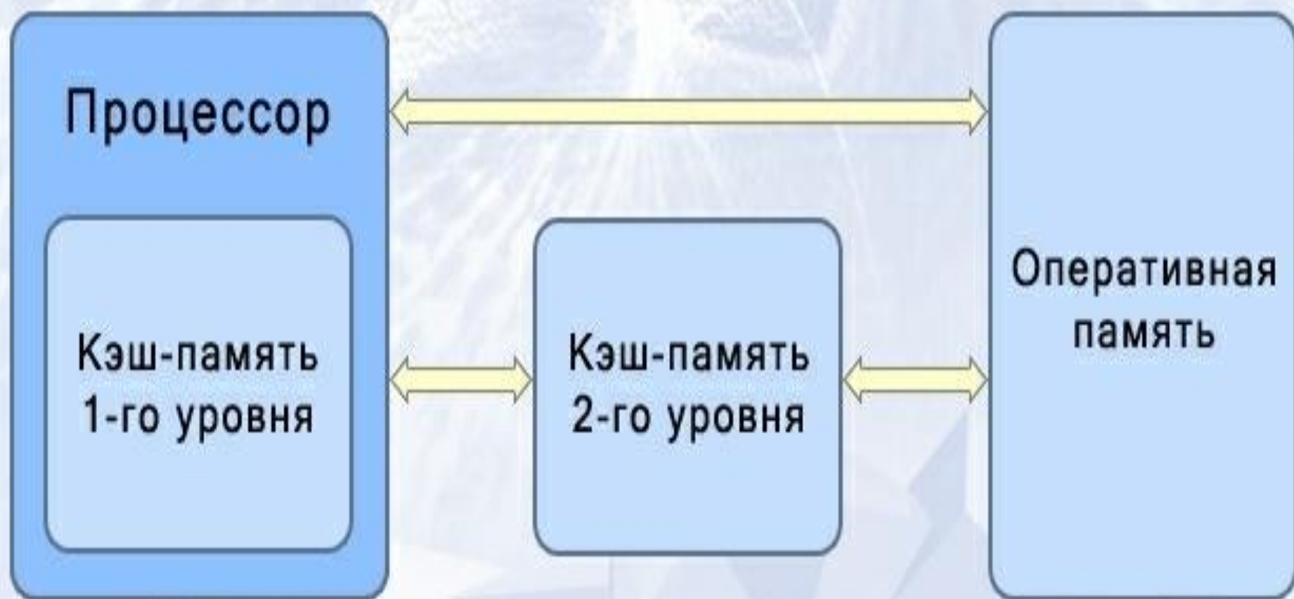
Схема устройства кэш-памяти