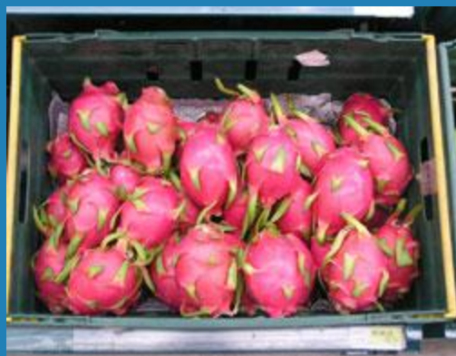
питайя- дракон фрукт