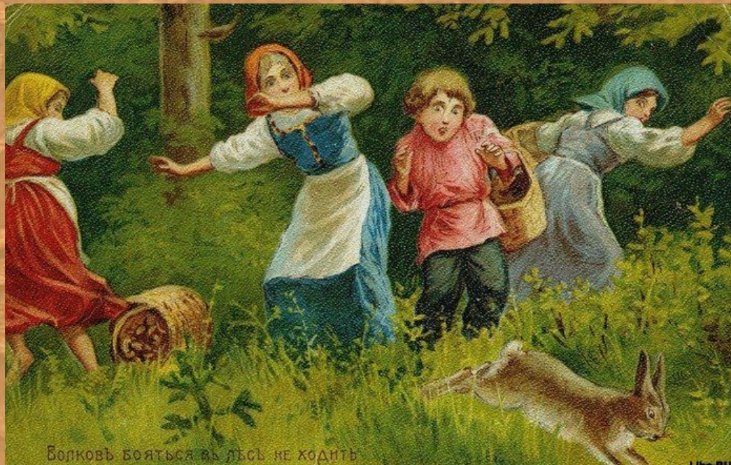
Волков бояться в лес не ходить

Поговорка — это лишь часть суждения, в ней нет вывода, заключения.