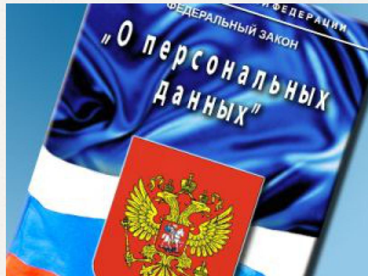
Рис.2 Закон №152-ФЗ «О персональных данных»