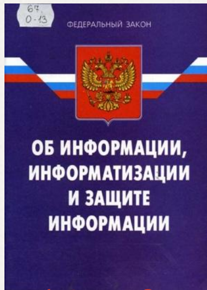
Рис.1 Закон Российской Федерации №149-ФЗ «Об информации, информационных технологиях и защите информации»