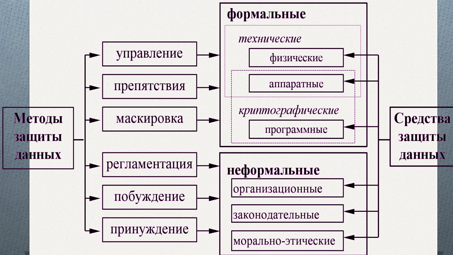
Табл. 1 Методы защиты информации