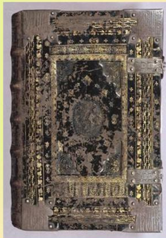
Так выглядели первые книги