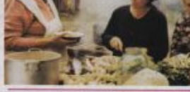
1-я обложка: 2-я обложка:

16 БЛАГОВЕСТ Святитель и хирург Лука: «Я люблю страдания...» . В миру он был прославленным хирургом, хирургическим врачом. По убеждениям — православным христианином. По духовному званию — архиепископом. А по смерти — причислен церковью к сонму святых, просиявших в Земле Русской в XX веке.