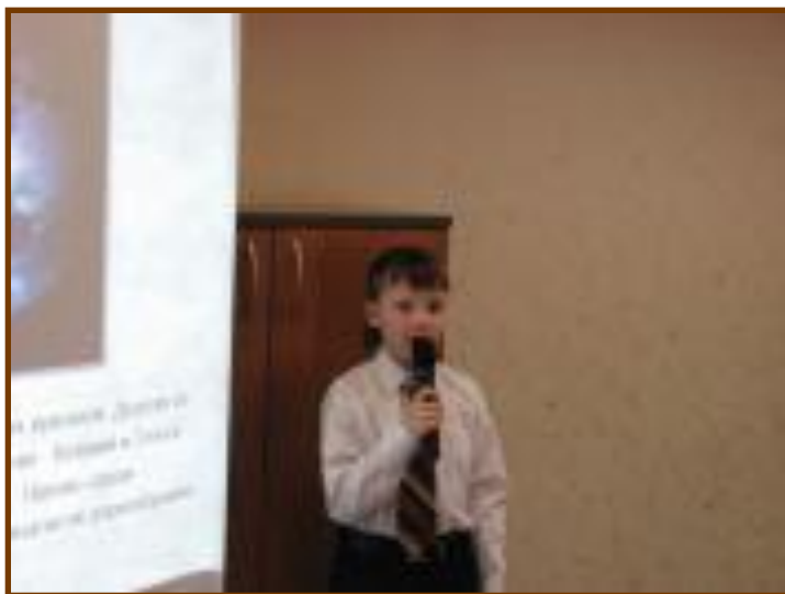
Проведение уроков на распределенную аудиторию