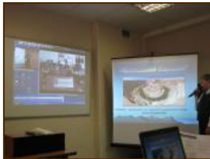
Видеоконференция «Шаг в будущее»