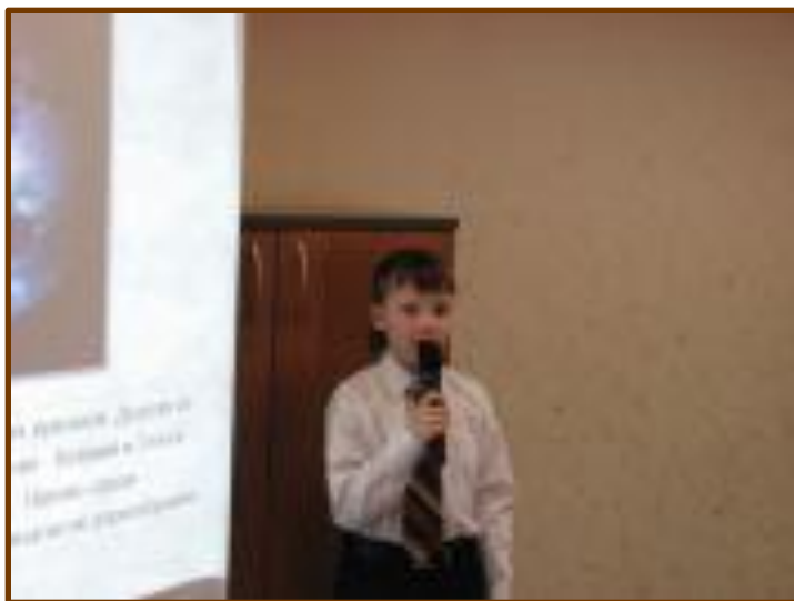
Проведение уроков на распределенную аудиторию